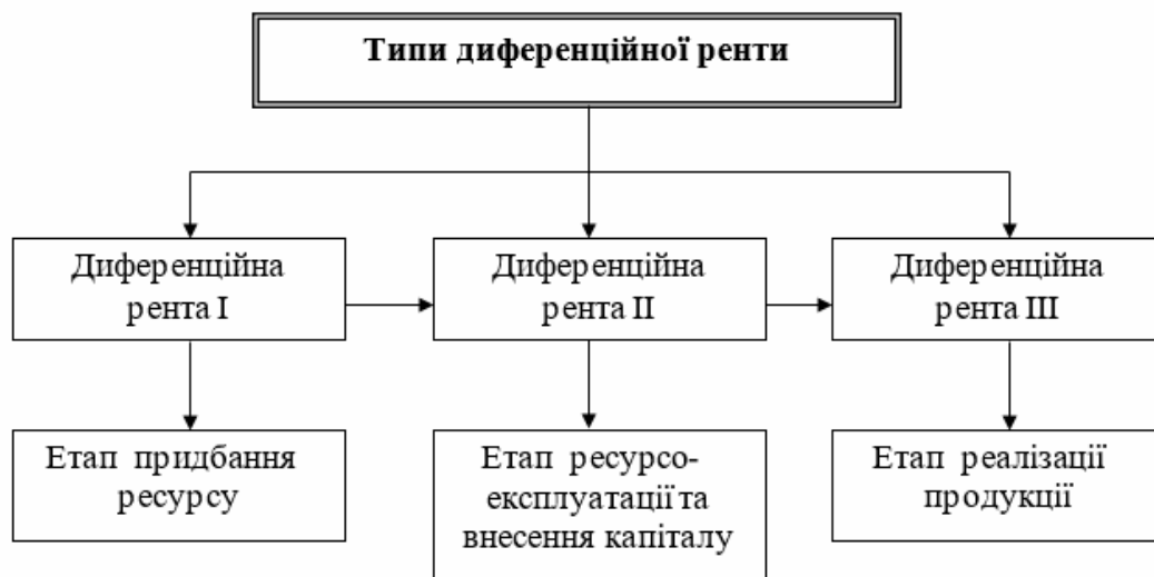
Рис. 3. Типологізація диференційної ренти за виробничими етапами (складено автором)